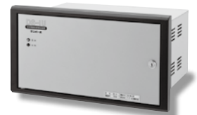
直流電路地絡検出装置 DS-IU(副装置)