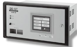
直流電路地絡検出装置 DS-ST