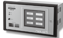
直流電路地絡検出装置 DS-IT