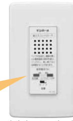
音声表示器の表示例