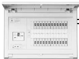
パールデクト (分電盤の例)