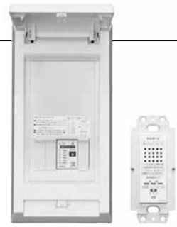
PC-4SPMA1L 音声表示器別置きタイプ

いつも何気なく使っている電気。 今どのくらい使っているのか「見える」ため、 その日から意識が変わるきっかけになります。