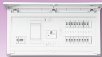
パールテクト(扉付)