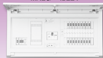
パールテクト(扉付)