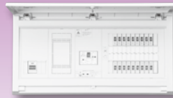
パールテクト(扉付)