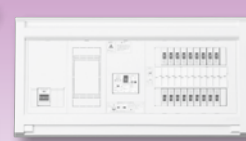
パールテクト(扉なし)