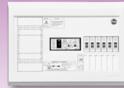
パールテクト(扉なし)