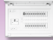
パールテクト(扉付)