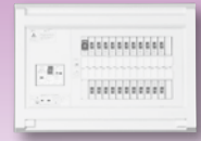
パールテクト(扉なし)