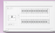
パールテクト(扉なし)