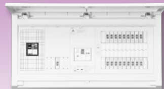
パールテクト(扉付)