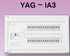
パールテクト(扉なし)