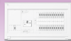
パールテクト(扉なし)