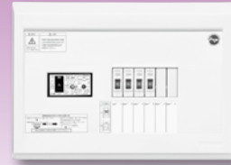
パールテクト(扉なし)