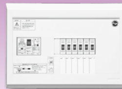
パールテクト(扉なし)