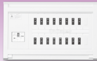
NEWスマートばん(扉なし)