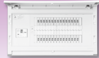
パールテクト(扉付)埋込形