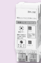
感震センサーユニット ES-2B