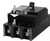
■ 封印板(標準付属) EC(30AF~60AF)