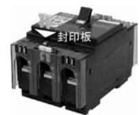
■ 封印板(標準付属) KC(30AF~100AF)