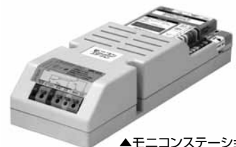
▲モニコンステーション AMC-ST3