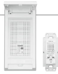
PC-4SPMA1L 音声表示器別置きタイプ