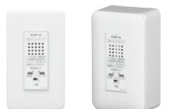
1個用スイッチボックス組込例 スイッチボックスとスイッチプレート は市販品をご使用ください。