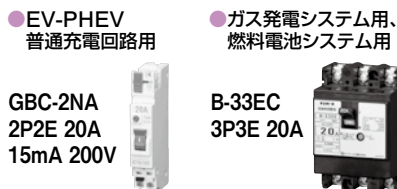
GBC-2NA 2P2E 20A 15mA 200V