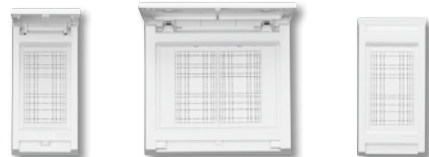
SP-MA1L/SP-MA1S SP-MA2 SP-YA1L/SP-YA1S

既設の住宅用分電盤への追加や組み合わせで、太陽光発電システム、EV・PHEV普通充電回路、家庭用燃料電池システム、オール電化住宅対応のブレーカの増設用途等に!