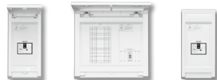
SP-MA1LB30 SP-MA2P20EV SP-YA1SB20