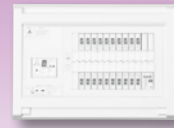
パールテクト(扉なし)