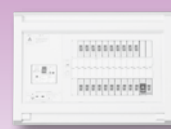
パールテクト(扉なし)