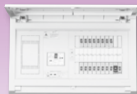
パールテクト(扉付)