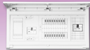
パールテクト(扉付)