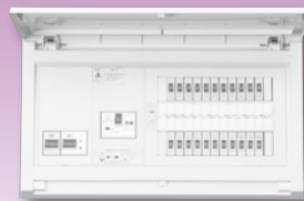
パールテクト(扉付)