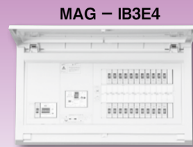
MAG - IB3E4