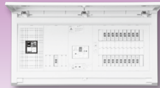
パールテクト(扉付)