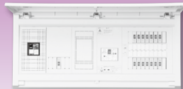
パールテクト(扉付)