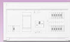
パールテクト(扉なし)