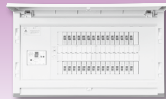
パールテクト(扉付)埋込形