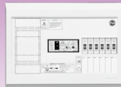
パールテクト(扉なし)