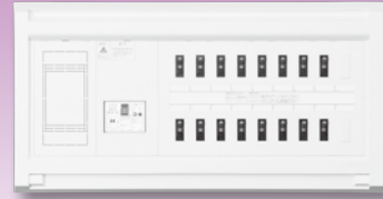
NEWスマートばん(扉なし)