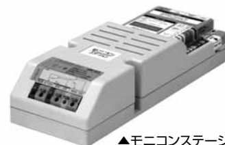
▲モニコンステーション AMC-ST3