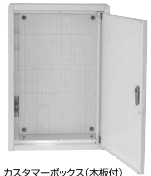
カスタマーボックス(木板付)