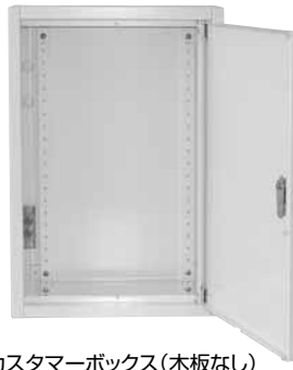
カスタマーボックス(木板なし)

分電盤、制御盤、端子盤、 情報通信機器収納用などにも ご使用いただける多用途形です。 塗装は傷がつきにくくサビに強い 粉体塗装を採用。