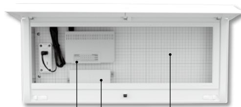
スイッチング HUB 電話端子台 機器取付スペース 他の情報機器あるいは映像系の機器などをお取り付けください

スタンダード オール電化対応 発電システム対応 機能付 EVEVE回路付 官公庁対応 WHボックスその他 毒分岐プレカ覽 オフィス 資料 外形寸法図 生産終了品