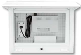
スイッチング HUB(8ポート) 電話端子台 組込例