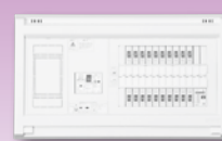
パールテクト(扉なし)