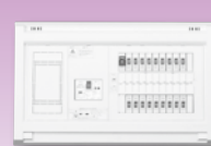
パールテクト(扉なし)