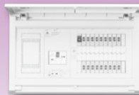
パールテクト(扉付)