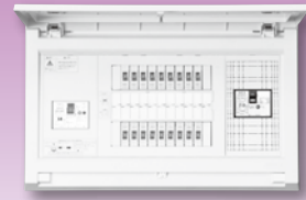
パールテクト(扉付)