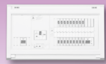
パールテクト(扉なし)