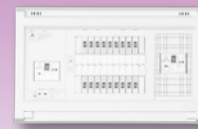
パールテクト(扉なし)