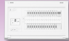
パールテクト(扉なし)