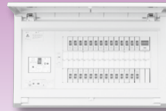
パールテクト(扉付)