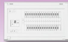
パールテクト(扉なし)