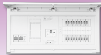
パールテクト(扉付)