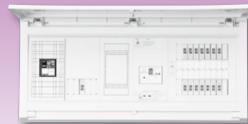
パールテクト(扉付)