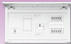
パールテクト(扉付)