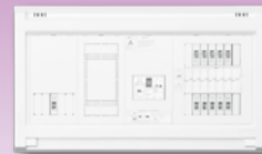
パールテクト(扉なし)