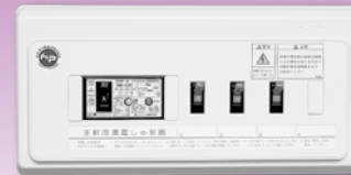
スマートばん(扉なし)