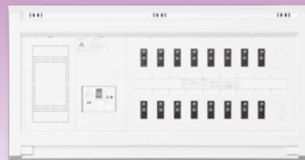
NEWスマートばん(扉なし)