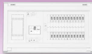
パールテクト(扉なし)