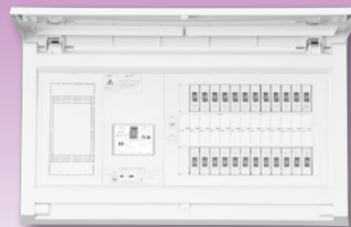
パールテクト(扉付)