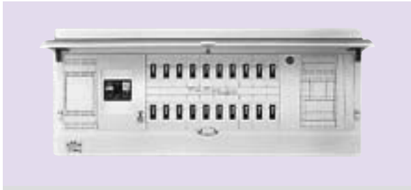
付属機器取付スペース付 タテ ヨコ フカサ フカサ 180×90×60(露出)45(埋込)